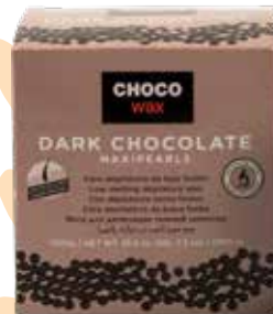
CERA DEPILATORIA DE BAJA FUSIÓN LOW MELTING DEPILATORY WAX CIRE DÉPILATOIRE BASSE FUSION