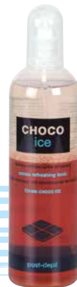
TÓNICO REFRESCANTE REFRESHING TONIC LOTION TONIQUE REFRAÎCHISSANTE

La lotion tonique Choco Ice, dotée d'une texture légère, constitue le complément idéal des soins paraffines Choco Beauty et des soins épilatoires Chocowax. Sa composition avec beurre de Cacao et Urée lui confère un effet emollient et adoucissant. Récipient de pulvérisation facile à appliquer.