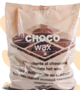
CERA CALIENTE EN DISCOS HOT WAX DISCS CIRE TRADITIONNELLE DISQUES