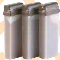
CERA LIPOSOLUBLE ROLLON LIPOSOLUBLE WAX ROLLON CIRE LIPOSOLUBLE ROLLON

Chocowax est notre ligne de soins épilatoires au cacao enrichie en Huile de cacao et Huile d'Amandes douces. Sa composition originale permet de réaliser une épilation douce et efficace, laissant la peau hydratée et régénérée. Légèrement parfumé. Pour tous les types de peau.