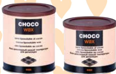
CERA LIPOSOLUBLE BOTE LIPOSOLUBLE WAX CAN CIRE LIPOSOLUBLE POT